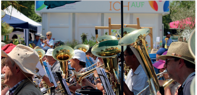
Zahlreiche Musikanten trugen zum Gelingen des Landesposaunentags bei