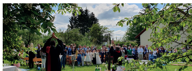
Feier der Vorkonfirmation im Johannesgarten

Raiffeisenbank Bibergrund-Petersberg e.G. DE 2253 0623 5000 0320 0450