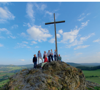
Pilgern am Wachtkuppel

Konfirmanden zusammenzukommen. Außerdem erkunden wir den Friedhof in Petersberg. Denn nicht nur gehen die Menschen zur Kirche. Die Kirche geht auch zu den Menschen. Eigentlich bilden nämlich wir Menschen in Gottes Gegenwart die Kirche. Dank vieler fähiger Ehrenamtlicher wird möglich, dass wir an den unterschiedlichsten Orten zusammenkommen und Gottes Nähe erfahren.