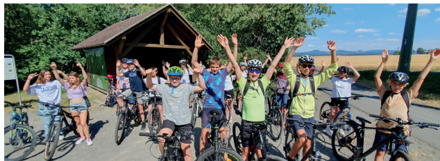
Radtour der Konfirmanden

Konfirmanden und Jugendliche sind im Sommer in Volkersberg geklettert und haben den Milseburgradweg unsicher gemacht. Die Mutigen haben sogar per Kanu die Fulda befahren. Im November machen wir uns ins Haus Oranien auf, um mit anderen