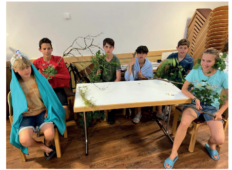
Unsere Konfis als "Ents" verkleidet.

entstand sogar eine eigene Film-Szene rund um das Abendmahl und den Kelch. Die dritte Einheit vertiefte das Thema Vergebung. Jesu Blut symbolisiert die Vergebung der Sünden, und die Konfirmanden lernten, wie wichtig Vergebung im Umgang mit anderen und sich selbst ist. Gesten zum Streit und zur Versöhnung wurden entwickelt und erleichterten das Verständnis. Die Freizeit bot aber nicht nur geistige Erlebnisse: Samstagmorgen begann der Tag mit Frühsport. Der Höhepunkt des Abenteuers war zweifellos der Hochseilgarten, in dem die Konfirmanden sich gegenseitig sicherten, über sich hinauswuchsen und sich freuten, wenn sie sich getraut hatten. Die Themenpalette der Konfirmandenfreizeit fand ihren Abschluss in einer Einheit über das ewige Leben. Die Einsetzungsworte wurden erforscht, der Begriff "Sünde" umgedeutet in „Gottesferne“ und eine Szene zum Thema ewiges Leben mit dem Handy aufgezeichnet. Spaß und Action kamen nicht zu kurz: Eine gigantische Wasserschlacht mit 888 Wasserbomben und spannende Teamspiele machten den Konfis viel Spaß. Am Sonntagmorgen war es dann schon nach einer kleinen Andacht und dem Frühsport zu Ende. Die Konfirmanden wurden von ihren Eltern mit unvergesslichen Eindrücken und neuen Freundschaften abgeholt. (Nuria Lange, 13 Jahre)