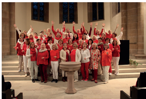
Gospel of Joy