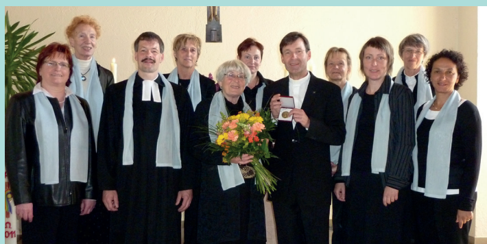
Verehrung der Elisabethenmedaille, 2011

Seeberg: Als Dekan bleibt man Pfarrer, aber in anderer Funktion. Im Laufe der Zeit hat die Landeskirche immer mehr Aufgaben auf die Ebene der Kirchenkreise verlagert. Zu der Personalverantwortung sind viele Steuerungsaufgaben hinzugekommen. Zum Kirchenkreis gehören neben den Kirchengemeinden und Kindertagesstätten auch ein Diakonisches Werk, das Diakoniezentrum und die Telefon-, die Krankenhaus- und Studierendenseelsorge und das Kirchenkreisamt.