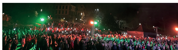
Weihnachtssingen auf dem Domplatz, 2022

Nachdem in 2022 der Domplatz bei eisigen Temperaturen mit 6.000 Menschen sehr gut besucht war, werden wir am Samstag vor dem 3. Advent, 16.12., 18:00 Uhr, vielleicht noch mal mehr Menschen erreichen. Also jetzt schon vormerken!