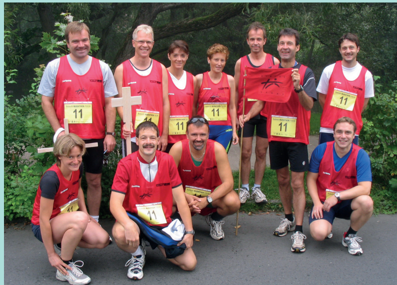
Fulda Halbmarathon, 2004

Meine Frau und ich haben zwei Kinder und vier Enkel, die im Rheingau und in der Schweiz leben. Die werden wir sicherlich öfter besuchen.