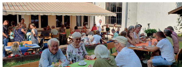
Impressionen vom Gemeindefest